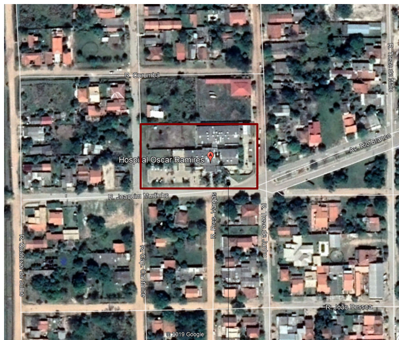
LOCALIZAÇÃO 1 : 20